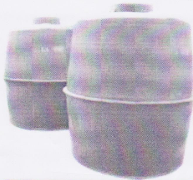
ถังน้ำทรงแอปเปิ้ล