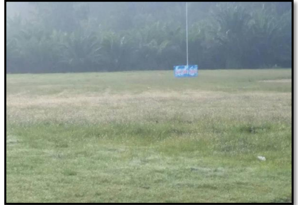
สนามฟุตบอล