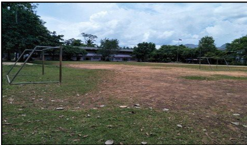
สนามฟุตบอล