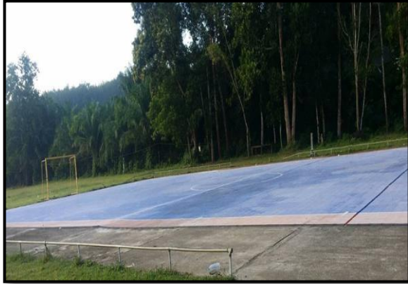
สนามฟุตซอล