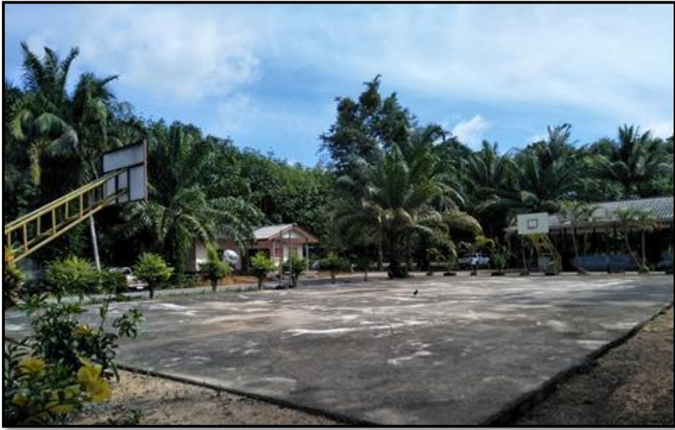
สนามบาสเกตบอล