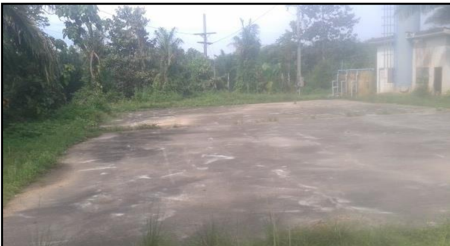
สถานที่ : โรงเรียนวัดสวนพิบูล