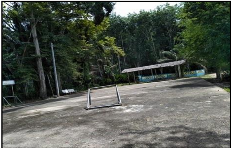
สนามฟุตซอล