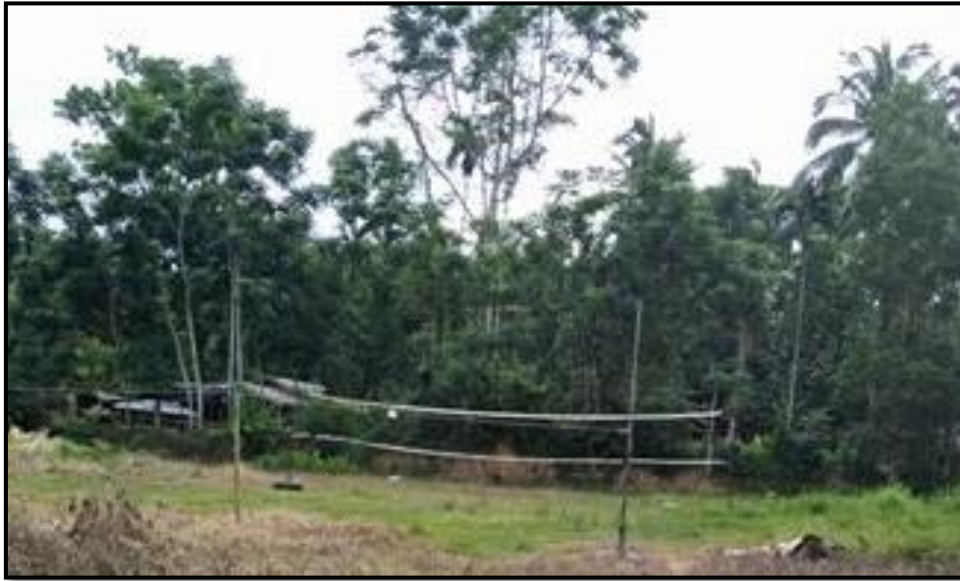
สนามวอลเลย์บอล

สถานที่ : ศาลาหมู่บ้าน หมู่ที่ 8 บ้านควนจำปา