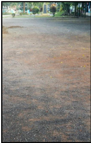
สนามเปตองตอง