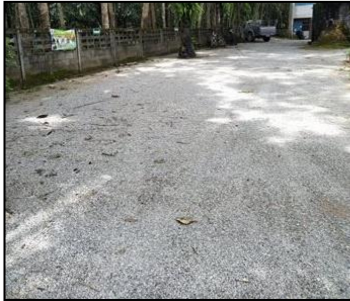
สนามเปตอง

สถานที่ : โรงพยาบาลส่งเสริมสุขภาพตำบลบ้านพรณราชเขต