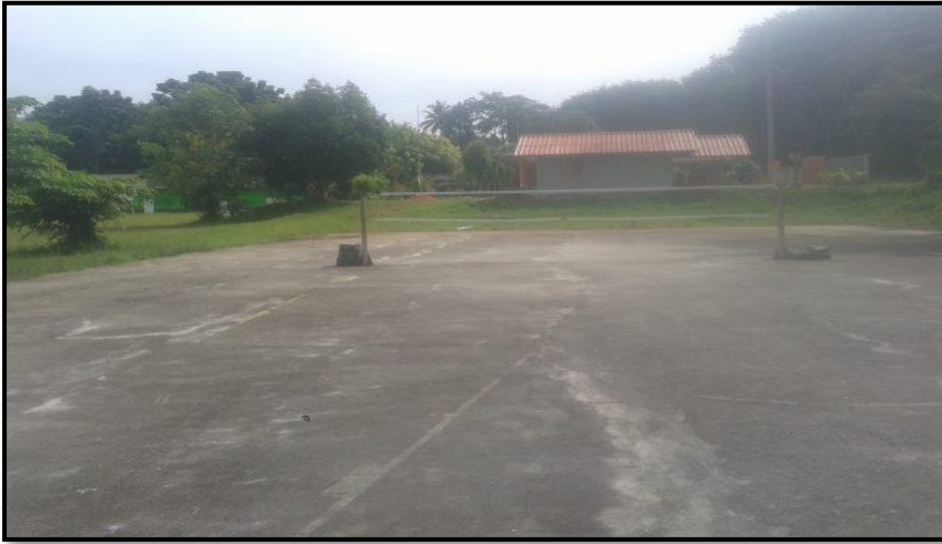
สนามวอลเลย์บอล