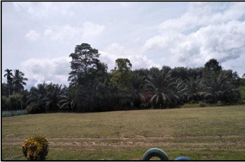
สนามฟุตบอล