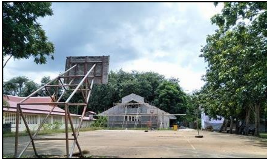
สนามบาสเกตบอล