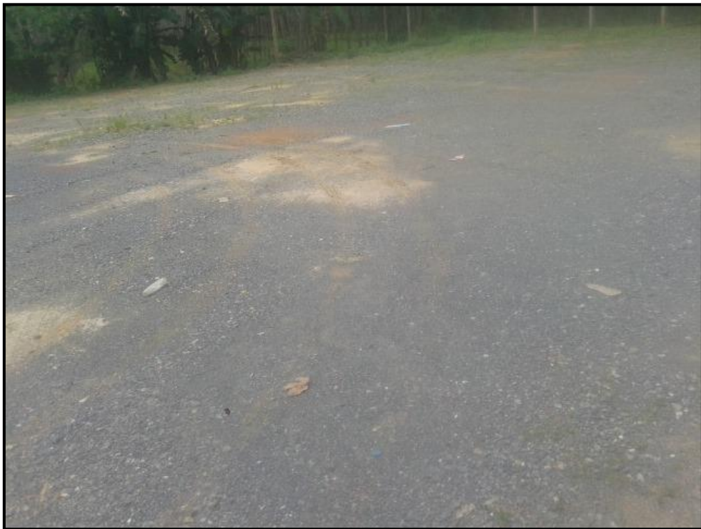
ลานกีฬา หมู่ที่ 7

สถานที่ : ศาลาหมู่บ้าน หมู่ที่ 7 บ้านคลองกา