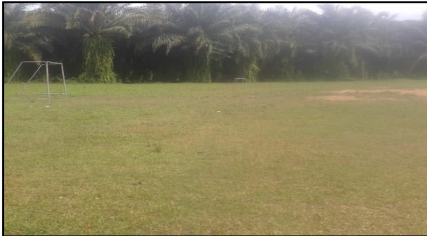
สนามฟุตบอล