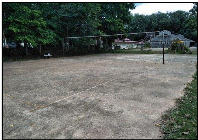
สนามวอลเลย์บอล