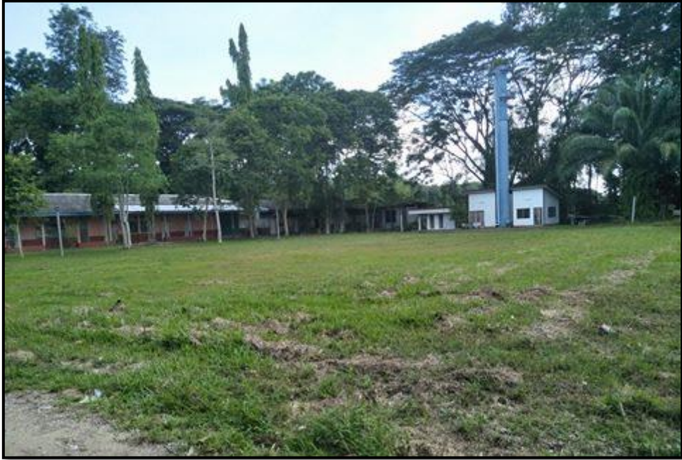
สนามฟุตบอล