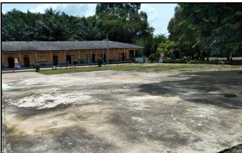
สถานที่ : โรงเรียนพรณราชเขต