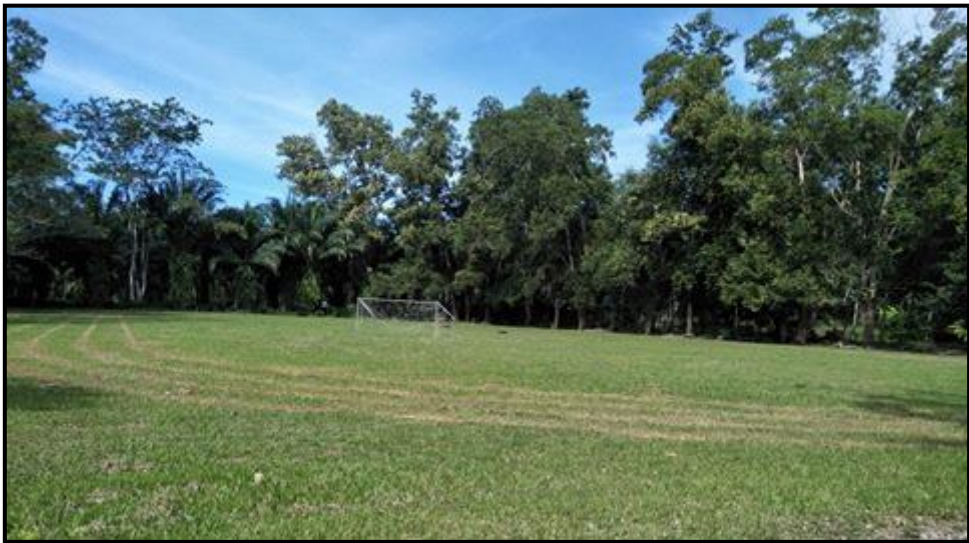
สนามฟุตบอล